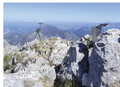
Cumbre del Tiatorδος

La ruta circular al Tiatorδος es un itinerario muy completo de montaña, seguramente una de las rutas más gratificantes que podemos hacer en Ponga . Es un trazado exigente, ya que para llegar a la cima hay que salvar un desnivel positivo de casi 1400m. Atravesamos lugares como la Foz de La Escalada , el bosque de La Bufona , la majada de Entregüe , nos asomamos al vecino concejo de Caso desde los Fitos , la majada de Brañadosu y la espectacular olla del Tiatorδος . Antes de completar el recorrido iniciado en Taranes , podemos visitar las localidades de Abiegos y Tanda .