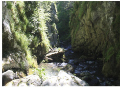
Desfiladero de la Foz de los Andamios

Esta ruta tiene una parte de carretera que transcurre por el estrecho desfiladero y una parte de pista forestal. Comienza en el puente La Huera , en la CN-625, desfiladero de los Beyos . La pequeña carretera asciende hasta Viboli . Unos 300m antes de llegar a esta localidad, debemos desviarnos a la izquierda por la pista ganadera que nos conduce sin pérdida por el monte Pedrosu, en las estribaciones de la Peña Sen de los Mulos , hasta la collada Granceno , cruce de caminos en el bosque de Peloño , desde donde podemos enlazar con varias rutas.