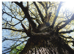
Roblón de los Bustiellos

Pista forestal que nos introduce en el Bosque de Peloño , reserva natural parcial, uno de los hayedos mejor conservados en España. Al aparcamiento de Les Bedules se accede por una pequeña pista de hormigón, cuyo desvío encontramos en la carretera entre las localidades de Beleño y Viegu . En el trayecto pasamos por varios puntos de interés como la collada Granceno , el roblón de los Bustiellos , la collada Guaranga (trincheres), y el bonito final de la pista en la majada de Arcenorio , donde podemos ver la ermita del mismo nombre y varias cabañas ganaderas.