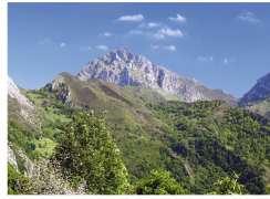
Picu Pierzu desde la parroquia de Cazo

La ascensión al Pierzu (1552 m) es una ruta de montaña muy asequible, ya que partiendo de una cota bastante elevada, el desnivel positivo a salvar apenas supera los 600m. Es un recorrido que por su ubicación, nos ofrece unas increíbles vistas panorámicas de todo el concejo de Ponga , Amieva y Picos de Europa . Todo el camino está señalizado con marcas blancas y amarillas propias de un PR. La ruta comienza en Collada Llomena , donde podemos aparcar el coche. Después de 2 km de pista de tierra, ascendemos por un pequeño sendero bien marcado.