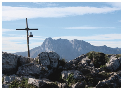
Cumbre de Peña Salón

Esta ruta nos ofrece un interesante itinerario de montaña, muy variado y con estupendas vistas panorámicas del desfiladero de los Beyos y el cordal de Ponga . Podemos comenzar en tres puntos diferentes; Viegu , Casielles o Viboli , y su trazado nos permite conectar con otras rutas como la Senda del Cartero o la Foz de los Andamios . La ruta pasa por lugares interesantes como la localidad de Biamón , la collada Nochendi o un pasadizo de roca natural al pie de la peña. La ascensión al pico no supone dificultad técnica y ofrece un mirador espectacular al macizo del Tiatorδος .