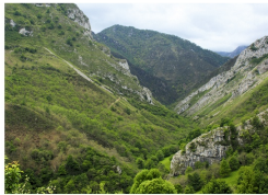
Valle del río Semeldón desde Cazo

Esta ruta nos lleva al hasta el collado Semeldón siguiendo el curso del río del mismo nombre y aprovechando el antiguo trazado ferroviario utilizado para la explotación maderera de la zona. El sendero comienza en Sellaño y está señalizado con marcas blancas y amarillas de PR. Aproximadamente a mitad de trayecto encontramos un cruce de caminos donde un cartel nos indica la dirección del collado y la localidad de Ambingue . En el camino de vuelta podemos tomar esta variante teniendo en cuenta que desde Ambingue a Sellaño hay que ir por carretera.