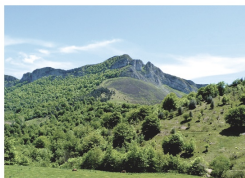
Sen de los Mulos desde Granceno

Podemos llegar al pueblo beyusco abandonado de Tolivia a través de un bonito trazado de montaña. Llegamos a la collada Granceno desde Les Bedules por la pista de Peloño . Aquí nos desviamos a la izquierda para coger un sendero bien señalizado. Rodeamos la peña Sen de los Mulos dejándola siempre a nuestra izquierda, a la derecha observamos la importante masa forestal del Bosque de Peloño . Una vez rodeada la peña comienza el descenso hacia Tolivia , pudiendo continuar la bajada hasta la carretera del Pontón (CN-625), en el valle del río Sella.