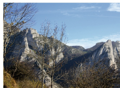
Vista desde Casielles

La Senda del Cartero es una ruta corta (2,5 km), con dos partes bien diferenciadas; la primera hasta la localidad de Biamón es un sendero de montaña con bastante pendiente. La segunda parte, de Biamón a Casielles , es una pista homigonada con parte de subida y parte de llano. Según ascendemos, las vistas que nos ofrece el valle del río Sella ( desfiladero de los Beyos ) son espectaculares. Todo el recorrido está muy bien señalizado con marcas blancas y amarillas de PR. Desde Casielles podemos enlazar con otras rutas como la ascensión a Peña Salón o la Foz de los Andamios .